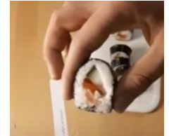
Sushi von Leopold & Pascal