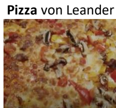
Pizza von Leander