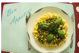
Nudeln mit Erbsen Von Leonard & Robert