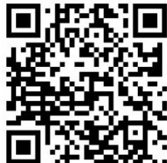
Kalte Nudeln von Shu-Fei